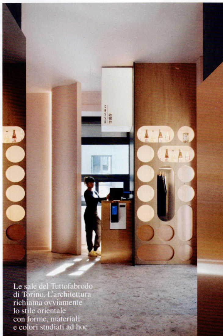
Le sale del Tuttotfabrodo di Torino. L'architettura richiama ovviamente lo stile orientale con forme, materiali e colori studiati ad hoc