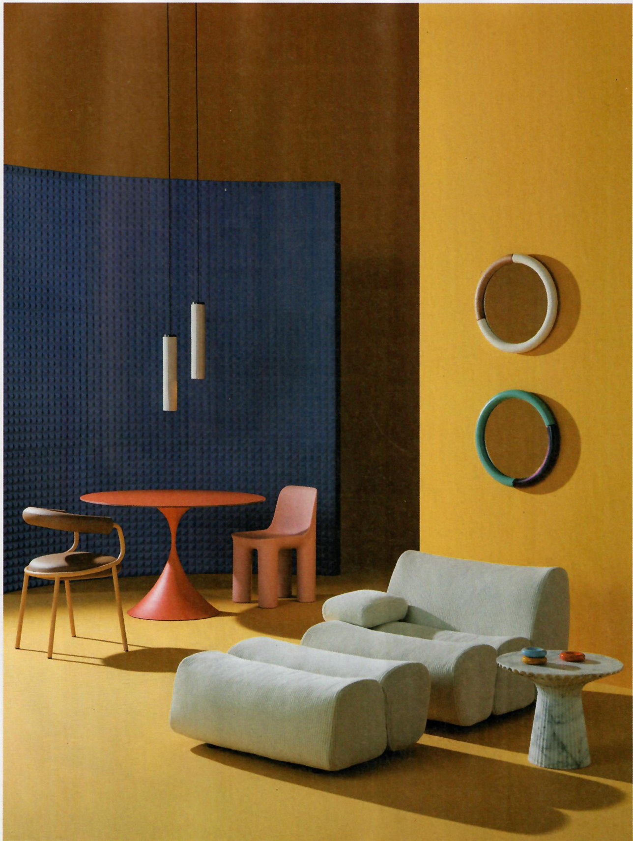
Chaise longue Ernest con rivestimento in tessuto Glasgow crema, Jean-Marie Massaud per Poliform. Tavolino Odette in marmo di Raffaello Galiotto, Lithos Design. Posacenere in ceramica di Simone Bonanni, Weed'd. Specchi Loopadelic in legno e Mdf, Arianna Crosetta per Scapin Collezioni. Sedia Koala Open in metallo e similpelle, Zaven per S-Cab. Tavolo Leo con basamento in metallo e piano in hpl, Paolo Vernier per Midj. Lampade a sospensione Dune in ottone e ceramica, Sara Moroni per Il Fanale. Sedia Tata in polietilene riciclabile di Stefano Giovannoni per Qeeboo