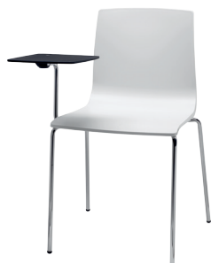
2678 TP II

Scocca in tecnopolimero riciclabile. Struttura in acciaio tubolare \varnothing mm 16 cromato con tavoletta scrittoio antipanico, movimento a ribalta. Impilabile. Per uso interno.